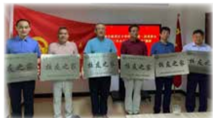
第一批校友之家所在企业及负责人