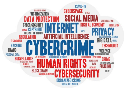
图3 网络法领域外文论文热点关键词