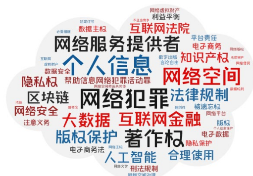
图4 网络法领域中文论文热点关键词

网络法相关论文中文来源出版物以法学、图书情报及综合性期刊居多，外文来源出版物以法学类期刊为主，近2年发文最多的前10种来源期刊见表3。